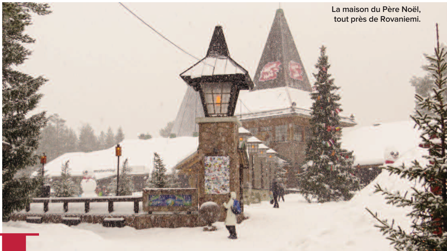
La maison du Père Noël, tout près de Rovaniemi.

La Laponie s'étend au nord de la Norvège, de la Suède, de la Finlande et de la Russie. C'est la terre des Sames, le dernier peuple autochtone du nord de l'Europe qui revendique ses propres culture et langue. Nous sommes allés en Laponie finlandaise, la province finlandaise la plus au nord, située en grande partie au-dessus du Cercle polaire. Les mois d'hiver, le mercure descend constamment sous les 25-30°C, mais on ne se rend pas compte qu'il si froid car il fait très sec. En décembre et en janvier, le soleil ne brille que quelques heures par jour, mais la neige offre des crépuscules féeriques. La meilleure période pour y passer des vacances d'hiver et profiter des célèbres aurores boréales ? De la mi-janvier à la mi-mars.